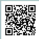
アドリンク ホームページ

株式会社アドリンクは外国人観光客の皆様が日本各地に“行ってみたい”、“また来たい”と 思えるような環境を実現し、インバウンド観光を通じて地域活性化に貢献します。