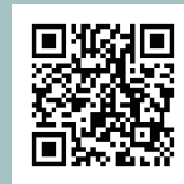
FBグループ 「インバウンドinfo」

〒601-8047 京都市南区東九条下殿田町43 2F TEL 075-662-8889 EMAIL info@addd-link.co.jp