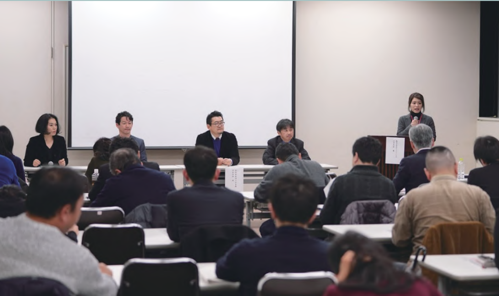
↑フォーラムの様子