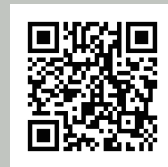
FBグループ 「インバウンドinfo」

〒601-8047 京都市南区東九条下殿田町43 2F TEL 075-662-8889 EMAIL info@addd-link.co.jp