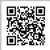
アドリンク ホームページ

株式会社アドリンクは外国人観光客の皆様が日本各地に“行ってみたい”、“また来たい”と 思えるような環境を実現し、インバウンド観光を通じて地域活性化に貢献します。